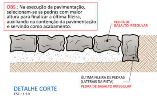
DETALHE CORTE ESC.: 1:10