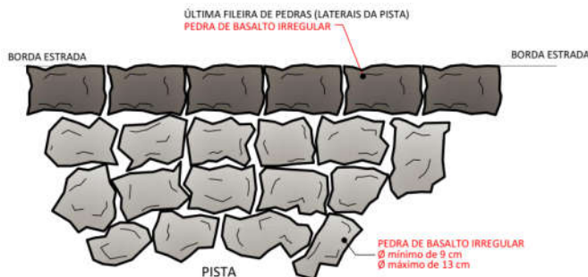
PLANTA BAIXA ESC.: 1:10

O calçamento e o meio fio ficarão na mesma altura. Conforme detalhe da Seção típica na planimetria correspondente.