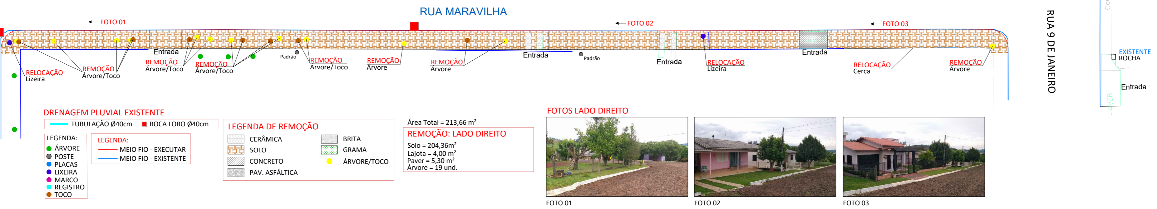
PLANIMETRIA ESC.: 1:250